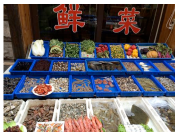
Markt in Qingdao