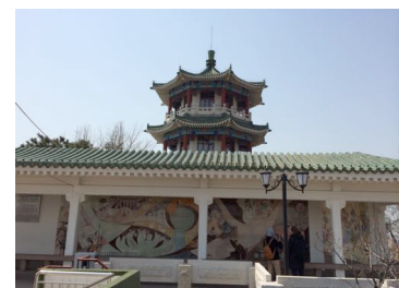
Tempel in Qingdao