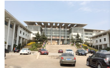
Die Chinesisch-Deutsche Technische Fakultät der Qingdao University of Science and Technology