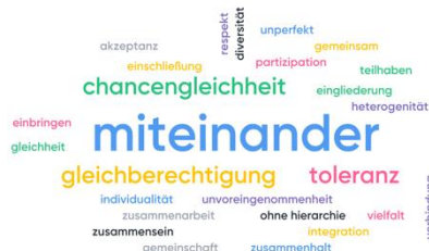
Beispiel einer Wordcloud

Welches Wort beschreibt Inklusion in Ihren Augen am besten?