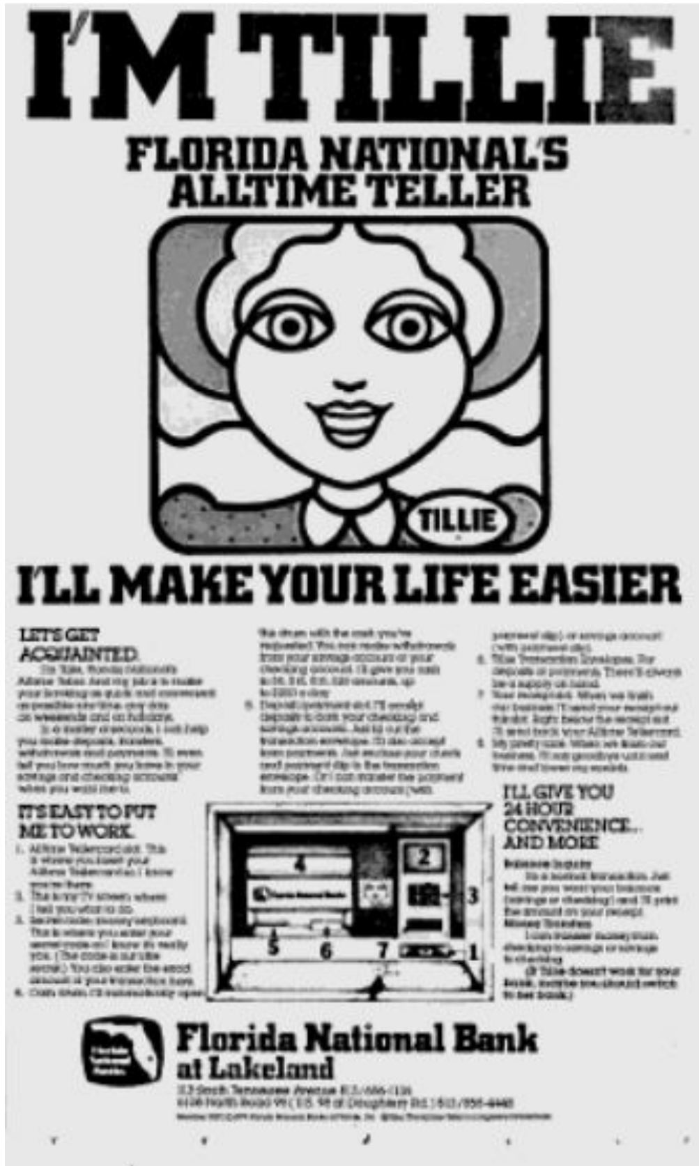
Abbildung 2: Printanzeige für Tillie.

Es ist kein Zufall, dass Tillie dafür mit einer Persönlichkeit versehen wird, die einem traditionellen Weiblichkeitsbild entspricht. Sie ist kokett und