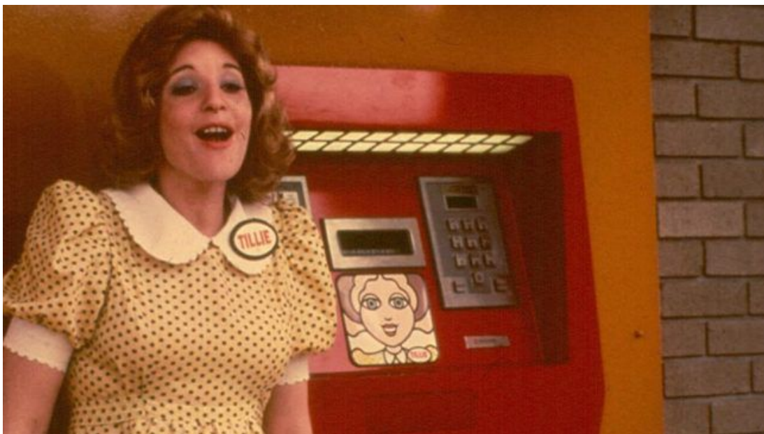
Abbildung 1: Tillie-Lookalike vorm Geldautomaten.

Tillies lächelndes Cartoongesicht ist sowohl auf den Geldautomaten als auch in Werbeanzeigen verschiedenster Art zu sehen. Sie ist weiß , blond, blauäugig und hat rotgeschminkte Lippen. Passend zu den rot-gelben Geldautomaten der First National Bank trägt Tillie ein gelbes Kleid mit roten Punkten, Puffärmeln und einem weißen Kragen, dazu eine ebenfalls rote Haube über ihren lockigen Haaren; am Kleid ist ein Namensschild mit der Aufschrift TILLIE angebracht. Kurzum: Sie entspricht westlichen Schönheitsidealen der 70er Jahre. Die Personifizierung Tillies wird durch das Anheuern junger Frauen als Tillie-Lookalikes unterstützt. Mit Kleidern, Frisuren, Makeup und Namensschildern, welche Tillies Cartoondesign gleichen, stehen diese Frauen neben den Geldautomaten bereit, empfangen Kund:innen und helfen ihnen bei der Bedienung der Automaten (vgl. ebd.) (Abb. 1). Das Bereitstellen von Bankangestellten zur Unterstützung bei der Nutzung von Geldautomaten ist bis in die 1990er Jahre nicht ungewöhnlich (vgl. Boyer/England 2008, S. 251f.), doch die Verkleidung als Tillie ist besonders: Die (fiktive) Figur Tillie wird mit einer realen Frau verbunden. Es findet eine Verschmelzung von Frau und Maschine statt, die durch physische Nähe und optische Angleichung gefördert wird.