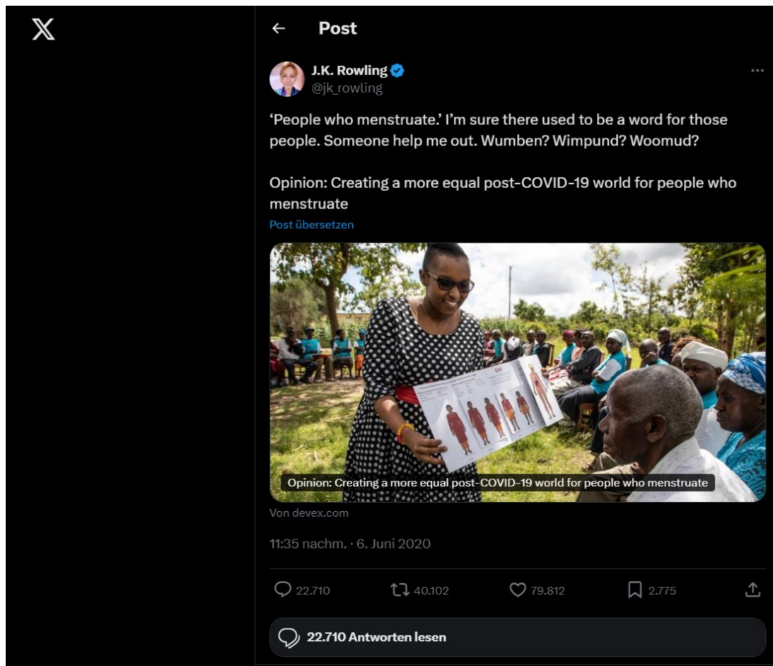
Abbildung 2: X-Post von Joanne K. Rowling.