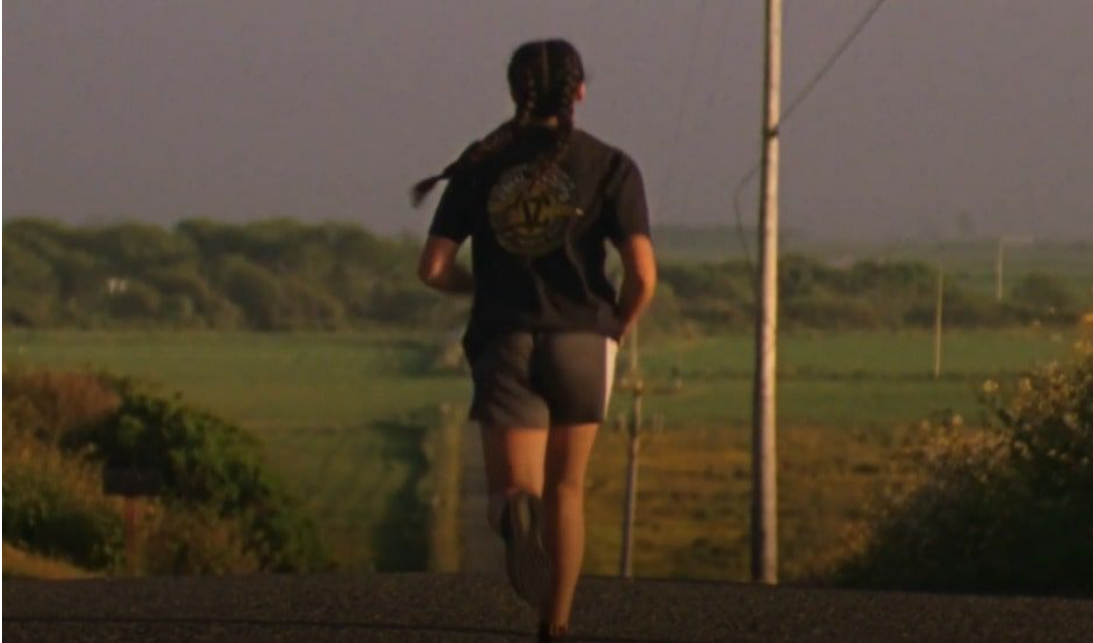
Abbildung 6: Athy beim Laufen.

zurückgelegten Weg – die Strecke, die noch vor ihr liegt, meistert sie mit Anmut und Vertrauen.