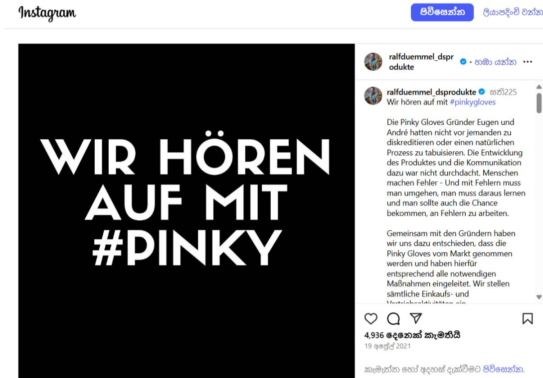
Abbildung 1: Instagram-Post von Ralf Dümmel.

Unternehmers Ralf Dümmel, der, wie er schrieb, keinen „natürlichen Prozess“ tabuisieren wollte.