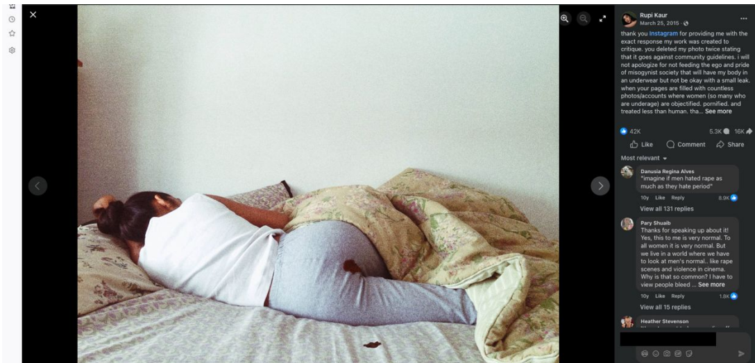
Abbildung 3: Facebook-Post von Rupi Kaur.