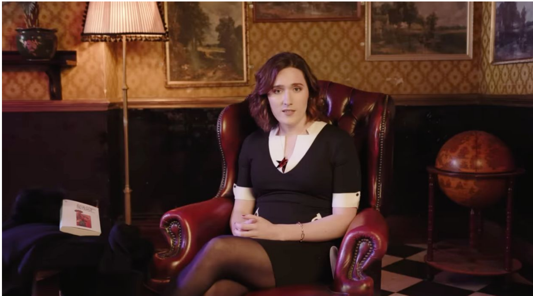
Abbildung 2: „I wish I could end today's video there.“

of the most recognisable trans people in Britain! Hooray! I'm the transgender princess of TERF Island! (Thorn 2021a, 33:40–34:10).