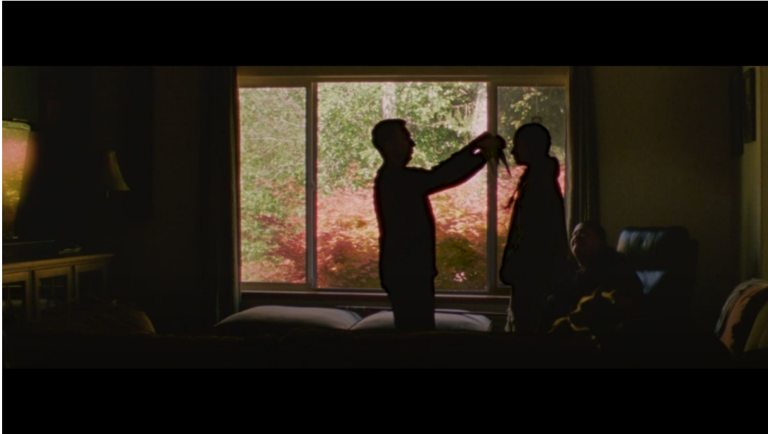
Abbildung 5: Athy studiert ihre ersten Tanzschritte.