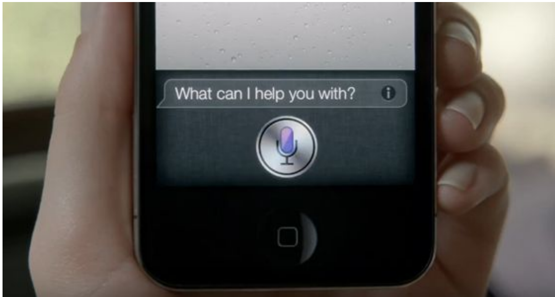
Abbildung 4: Siri-Interface in der Werbung.

Der Werbespot ist einer von vielen desselben Musters, die zum